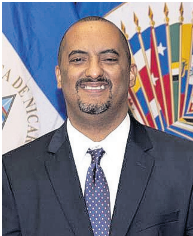
(AP) — Nicaragua's ambassador to the Organization of the American States said he had been feeling a "weight in his heart" for the last couple of weeks.

He said he lifted it on Wednesday when he denounced his own government as a "dictatorship" in a break with the administration of President Daniel Ortega.